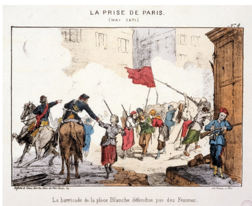
La prise de Paris (mai 1871) La barricade de la place Blanche défendue par des femmes.