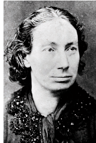
Louise Michel