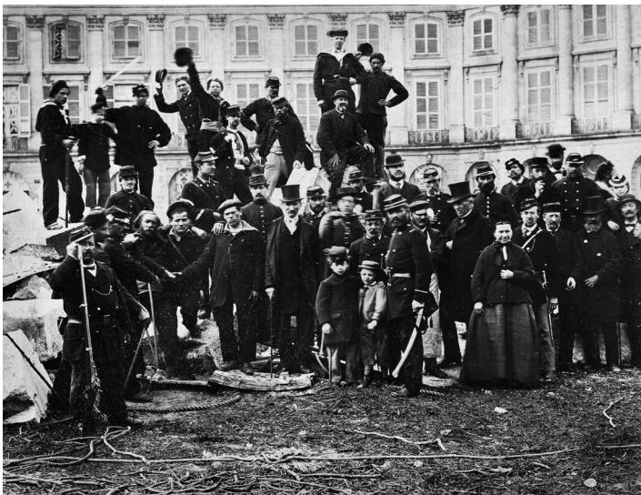
La Commune de Paris (1871). Vue de la place Vendôme